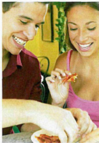
Pragmaticary, Foto: Liposinol

Liposinol aus der Apotheke, 60 Tabletten à € 38,50.